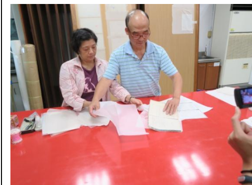
▲張修復師劣損檔案之裱修教學與實作_托裱紙質解說