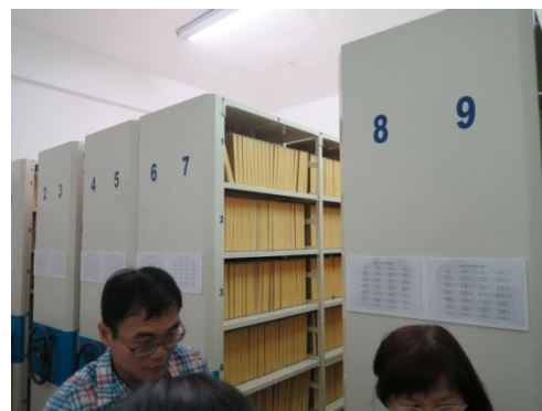
▲參觀嘉義大學第5屆獲金檔獎殊榮之檔案庫房_上架及檔案架標示