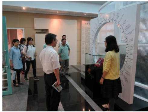
▲前副總統蕭萬長文物展