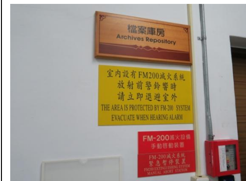
▲參觀嘉義大學第5屆獲金檔獎殊榮之檔案庫房_消防設備 FM200