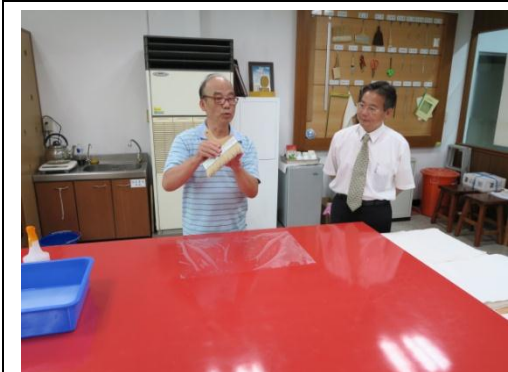
▲▲張修復師劣損檔案之裱修教學與實作_修護程序解說