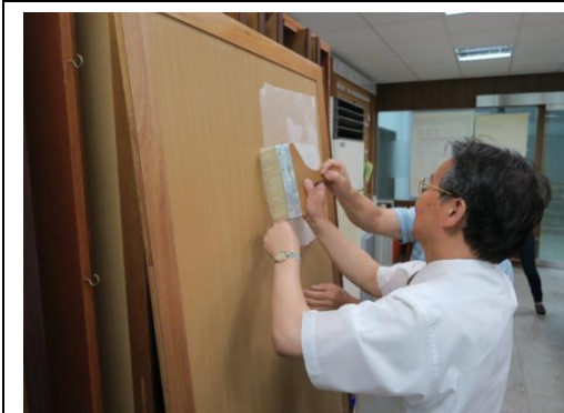
▲▲本局副局長親自進行修裱實作 2