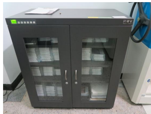
▲參觀嘉義大學第5屆獲金檔獎殊榮之檔案庫房_多媒體防潮櫃管理方式