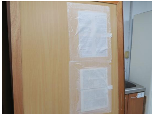
▲本局同仁完成修裱實作