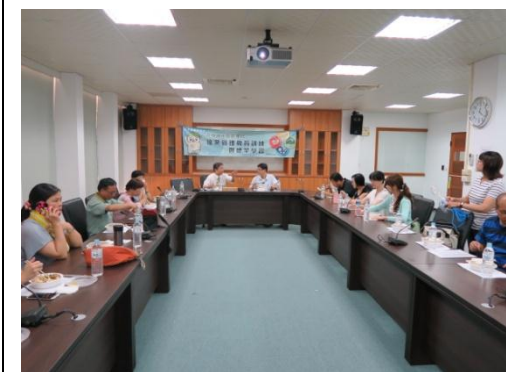
▲課程 Q&A 及經驗交流