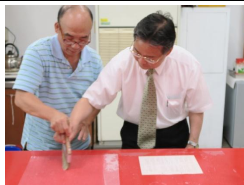
▲本局副局長親自進行修裱實作 1