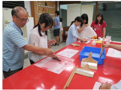
▲同仁進行修裱實作情形 2