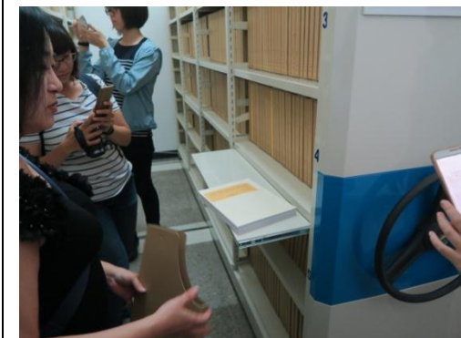
▲參觀嘉義大學第5屆獲金檔獎殊榮之檔案庫房_檔案架人性化設計