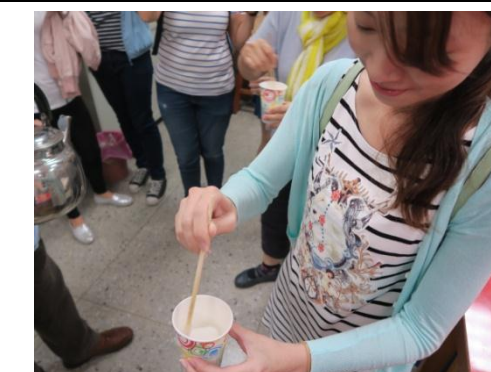
▲同仁實際操作調配糝糊