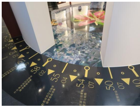
▲前副總統蕭萬長文物展，特別展出方式