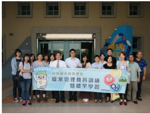
▲本局參予標竿學習同仁與講座合影