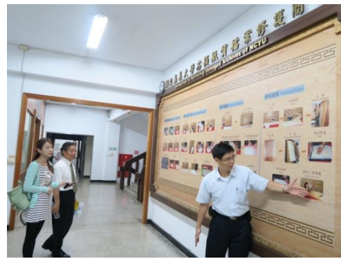
▲夏副教授進行紙質檔案修護介紹 3