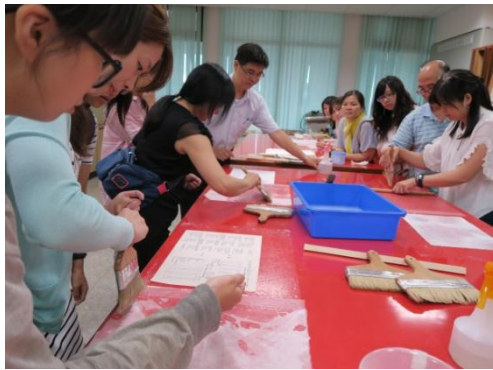
▲同仁進行修裱實作情形 3