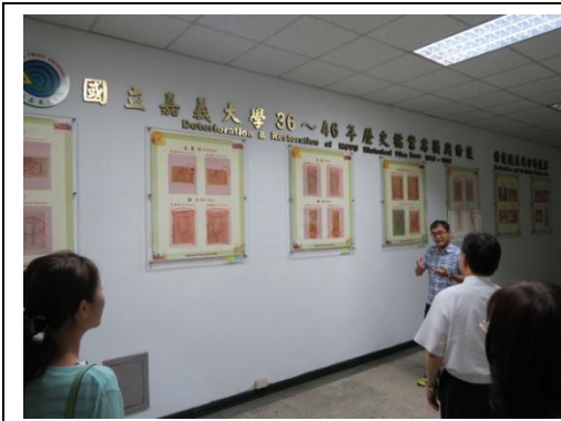
▲嘉義大學檔案修護成果呈現