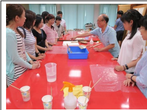
▲同仁進行修裱實作情形 1