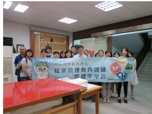
▲本次檔案修護課程圓滿結束合影