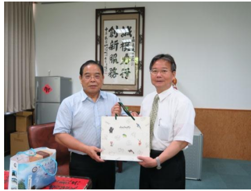
▲嘉義大學副校長與本局副局長合影